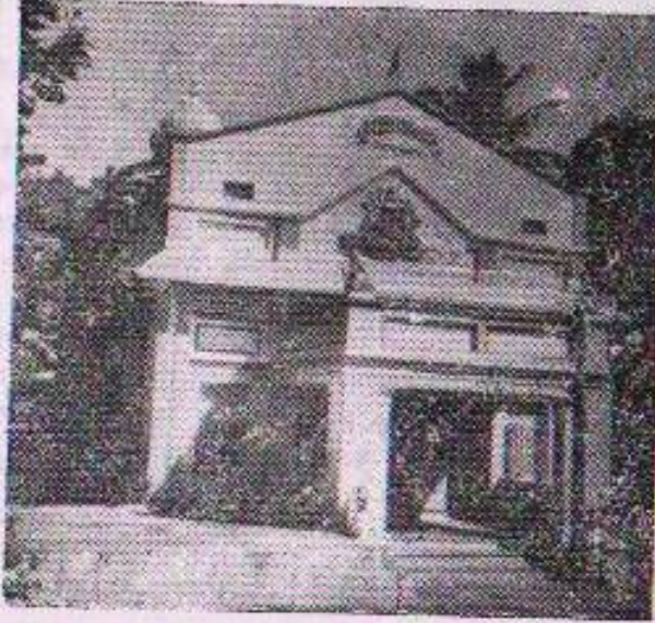
स्वा. सावरकरांच्या प्रेरणेने स्थापन झालेले सर्व हिंदूंना खुले असलेले रत्नागिरी येथील श्री पतितपावन मंदिर